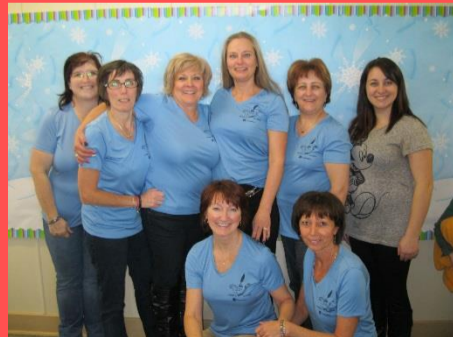
L'équipe école de St-Marc