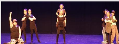
Concert de Noël