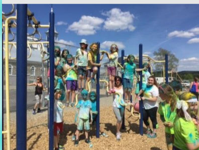
Visite des 2e année lors de l'activité