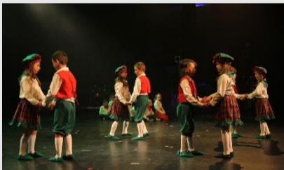
Prestation 31 e édition de la semaine des arts