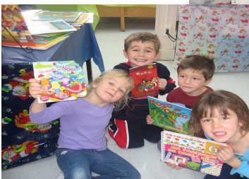
Festival du livre