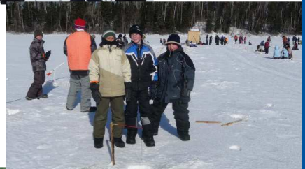
Activité de pêche sur la glace