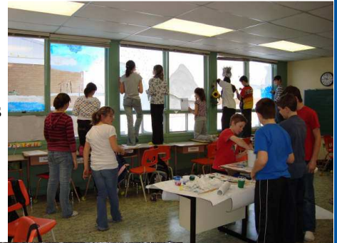
Peinture dans les fenêtres.