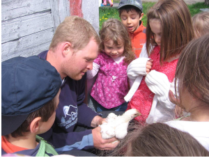
Visite de la ferme Cloutier