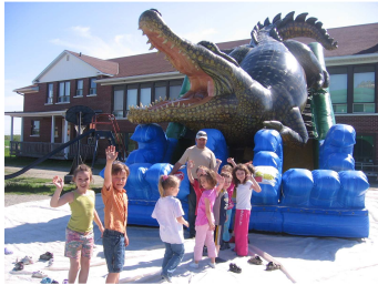
Activité des jeux gonflables