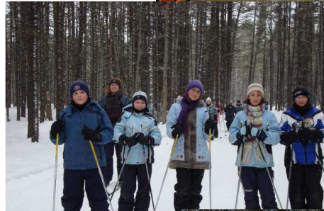
Activité de ski de fond.