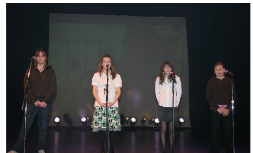
Spectacle de la semaine des arts