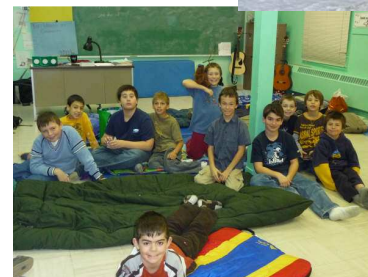
Coucher à l'école