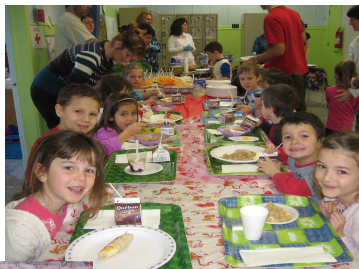
Déjeuner pyjama santé.