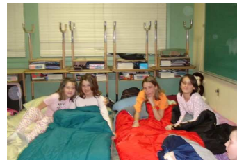
Coucher à l'école.