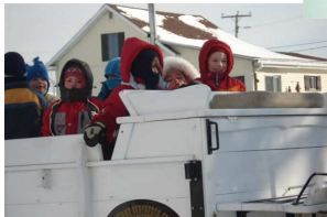
Activité blanche lors de la semaine des flocons.