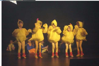
Spectacle de la semaine des arts.