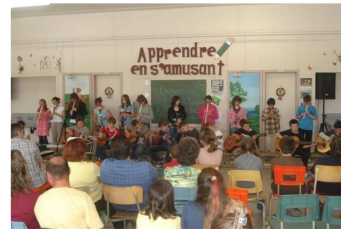
Spectacle de fin d'année.