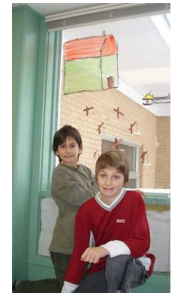
Activité de peinture dans les fenêtres.