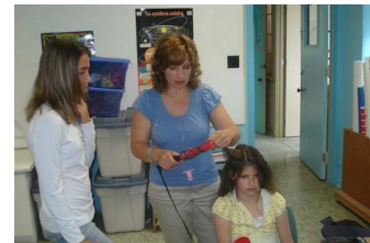
Atelier de coiffure lors de la journée des métiers.