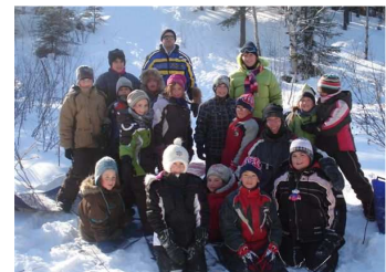
Activité de ski de fond.