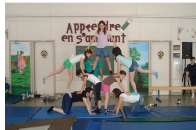
Spectacle de gymnastique