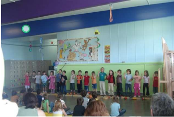
Spectacle de fin d'année, maternelle.