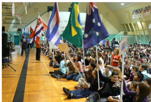
Lancement officiel de la 6 e édition du Mondial de soccer, octobre 2007