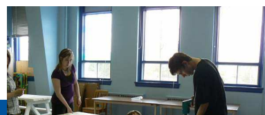
Projet « Tables de pique-nique »

Statistique intéressante : 99% de nos élèves sont demeurés à l'école jusqu'à la fin de l'année scolaire