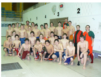
Concours de bombes