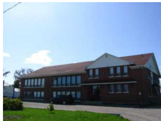
Notre projet éducatif et nos orientations

La diversité, les spécialités et la collaboration furent les trois éléments priorisés pour notre école pour l'année 2012-13