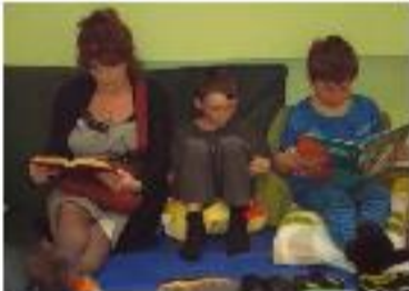
Petits et grands s'amuse lors de notre journée plein air d'hiver!