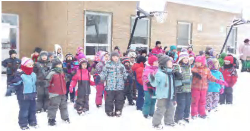
Les quantiques de Noël en plein air!