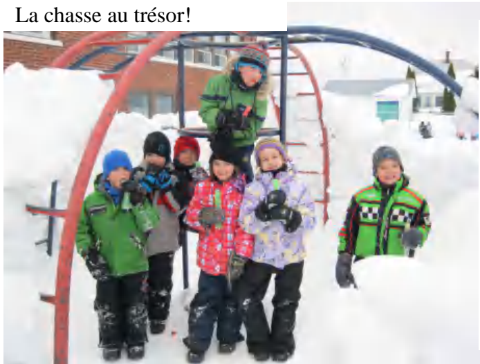
La chasse au trésor!