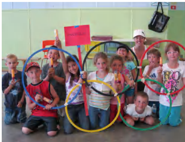
Nos équipes masculine et féminine à l'intra mural.