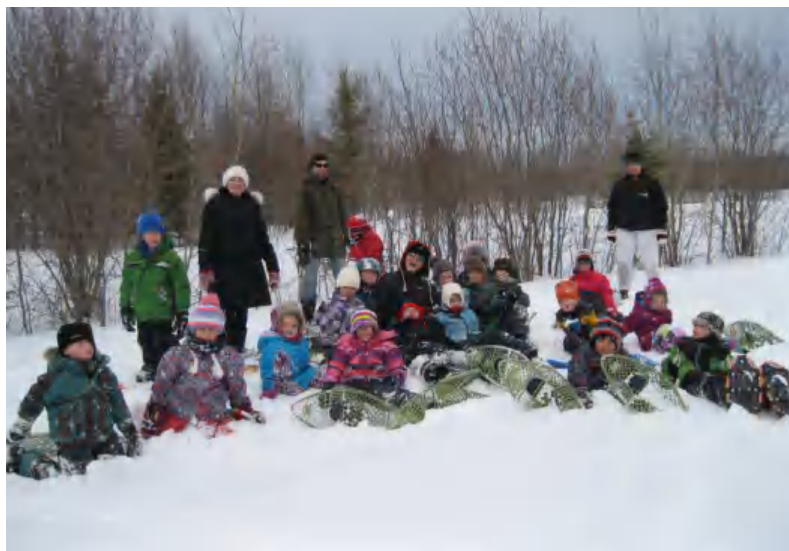
Randonnée en raquettes! Merci aux parents accompagnateurs!