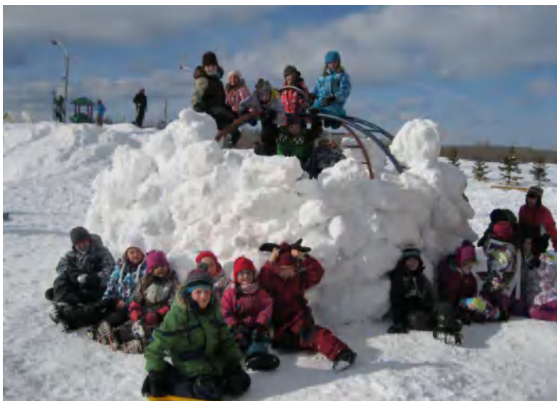
Construction d'un fort lors de la semaine des Flocons!