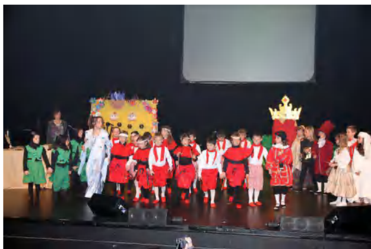
Spectacle à l'école! Beaucoup de parents présents!