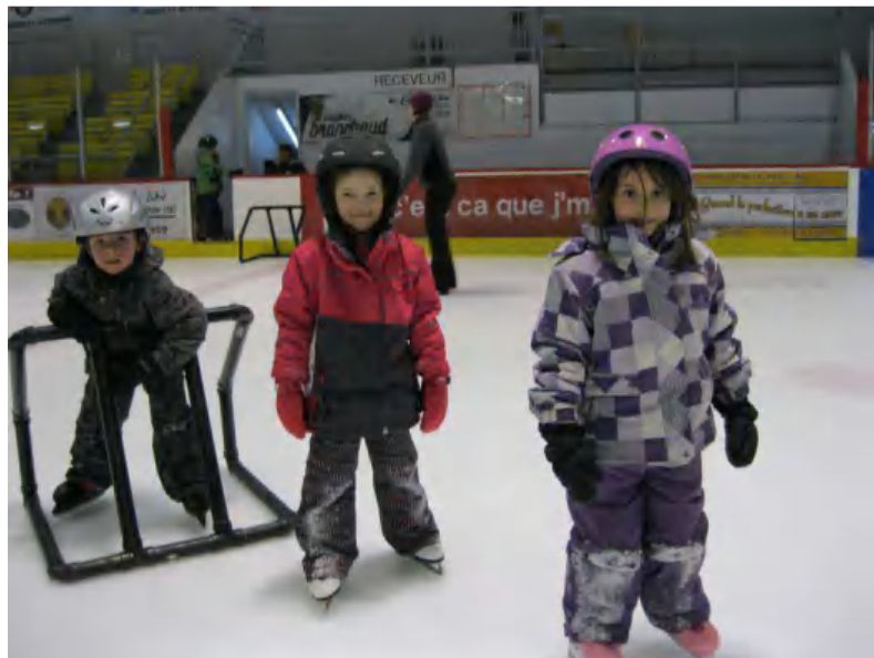
Visite à Berry!