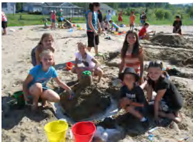
L'activité plein air de La Corne où les châteaux de sable étaient à l'honneur. Un bon déjeuner santé en plein air organisé par l'OPP.