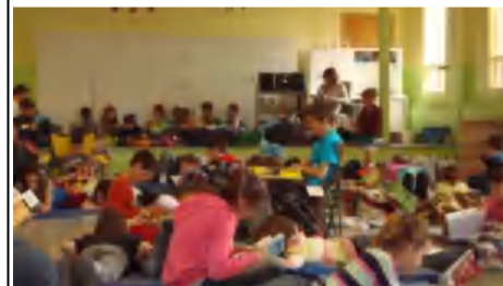
Lecturothon, mai 2012