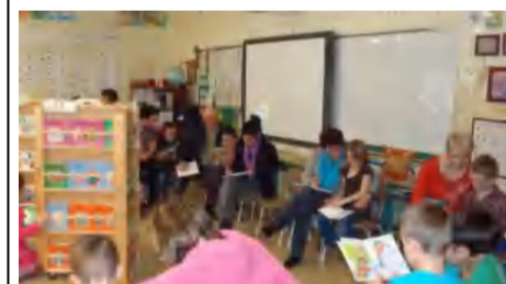
Papa, maman et grands-parents, MERCI de nous accompagner dans nos lectures!