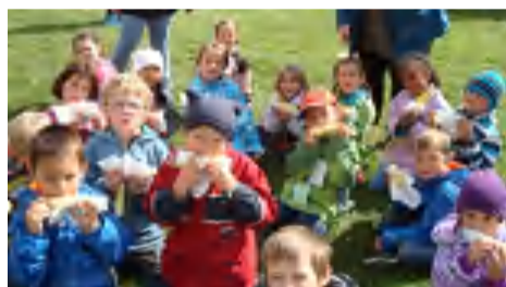
Dégustation de maïs à la rentrée!