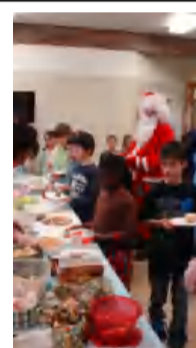
On se régale lors du dîner partage de Noël