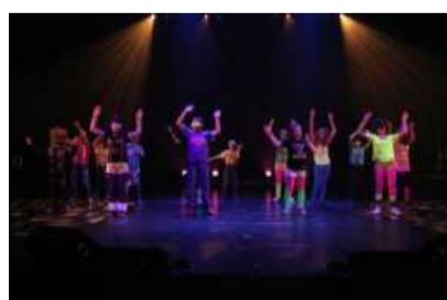
Les élèves de 6 e année et LMFAO!