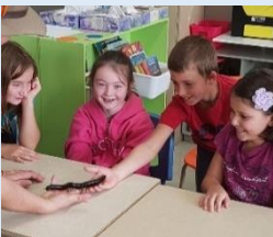
Activité de la rentrée