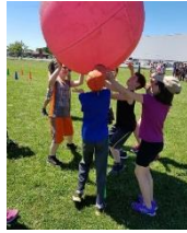
Grand défi 4 e année