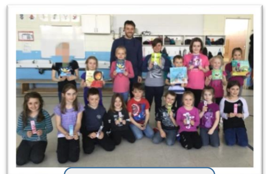
Mention spéciale pour le Festival de la lecture