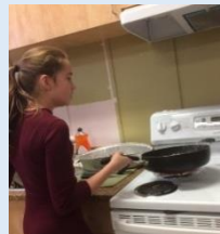
Dîner de Noël