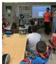
Visite conférencière Écolovrac