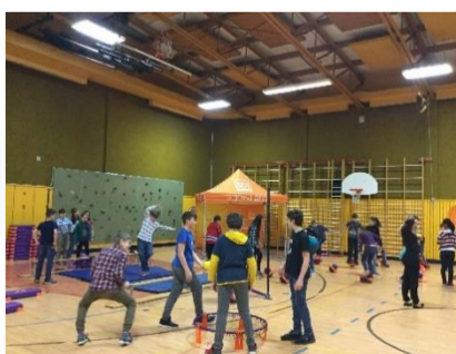
Activité de lancement du programme Force 4

De plus, grâce à notre participation, nous avons reçu de l'équipement et des idées pour faire bouger les élèves au moins une heure par jour, soit la norme que recommande l'Organisation mondiale de la santé pour la jeune population.