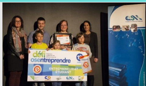
Gagnant local du Concours québécois en entrepreneuriat Projet : Lutrins pratiques pour élèves actifs de l'école Sainte-Grtrude de la classe 4 e année de Mme Josée Larouche