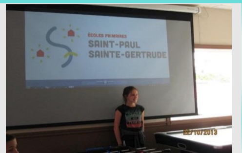
Dévoilement de notre nouveau logo pour les écoles Saint-Paul et Sainte-Grtrude