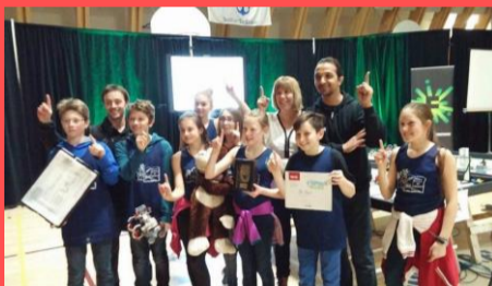
Champion de la finale régionale de robotique à Amos