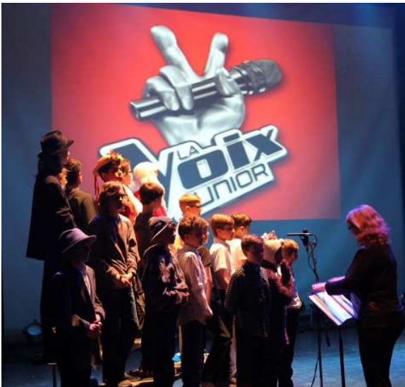
Conseil d'établissement 2016-17

Activité réalisée dans le cadre de la semaine des arts où la créativité était à l'honneur!