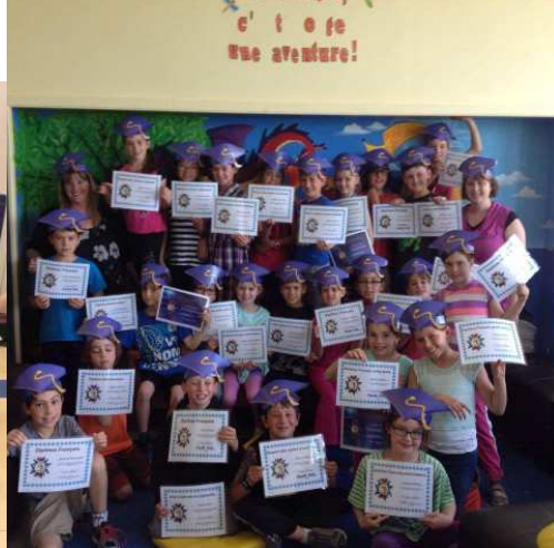
Plusieurs initiatives d'enseignantes pour souligner la reconnaissance et l'effort!