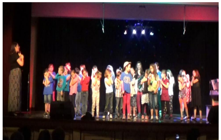
La chorale de NDSC