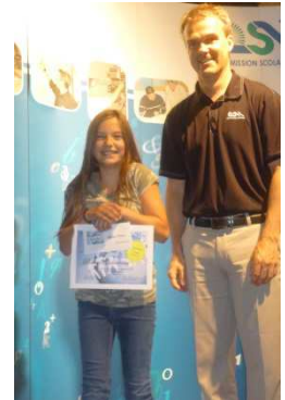
Génies en herbe