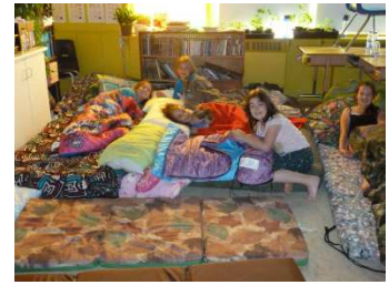
Coucher à l'école des élèves de 3 e -4 e année à Preissac