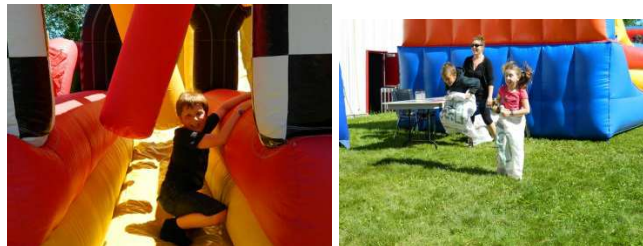
Fête foraine de fin d'année