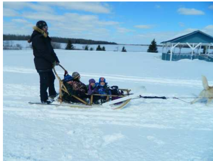
Activités d'hiver à Ste-Gertrude