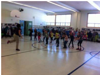
Zumba à Ste-Gertrude