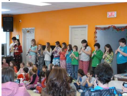
Spectacle de Noël à Preissac