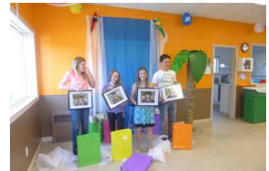
Remise de prix par la municipalité de Preissac aux finissants