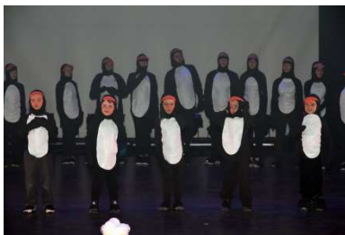
Spectacle de la semaine des arts