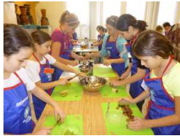
Ateliers 5 épices