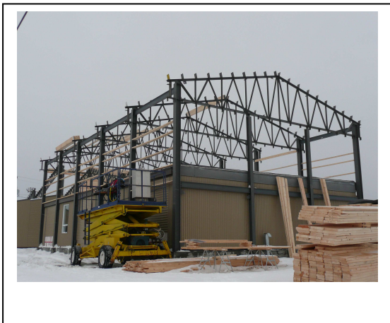
Rénovation du gymnase école Tétreault