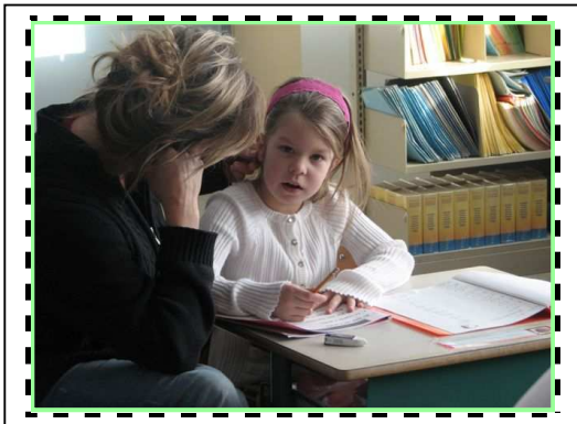
Atelier de lecture avec les parents