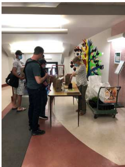
Mois de l'arbre et des forêts