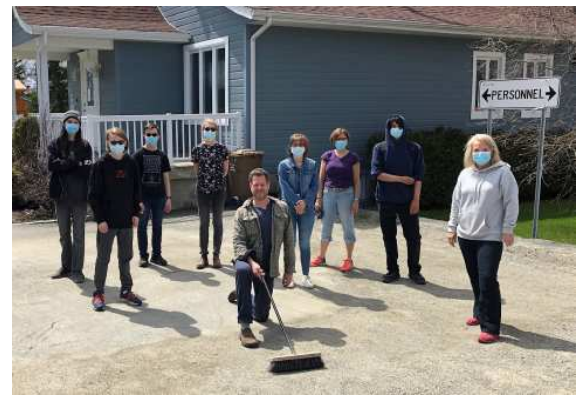
Corvée printanière à la Maison du Bouleau Blanc