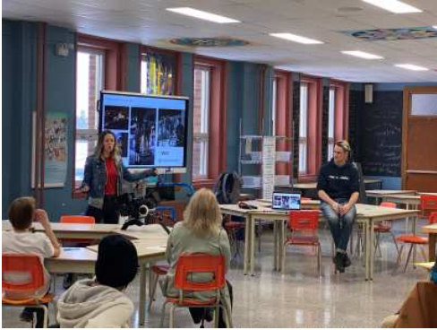
Conférence de l'entreprise BOJO's Film