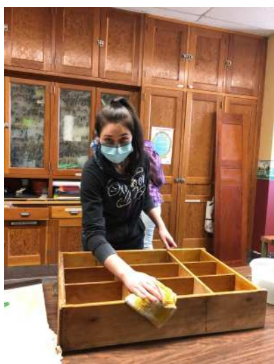
Projet Créations déco