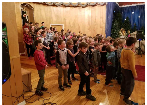
Spectacle de Noël à l'église de St-Dominique