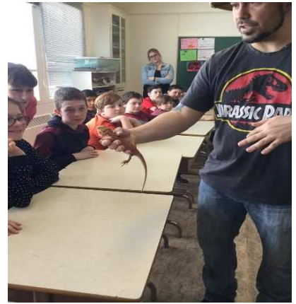
Labyrinthe des insectes à l'école