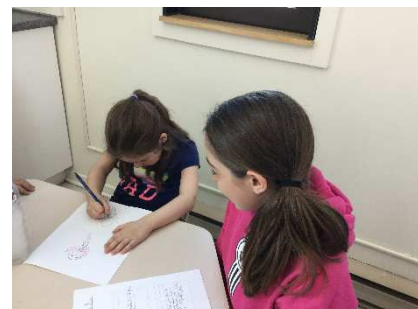
Projet d'écriture St-Félix/St-Dominique