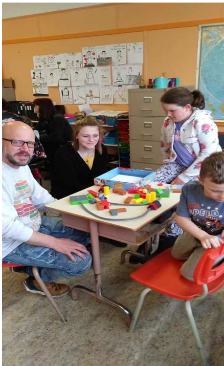
Soirée de jeux société