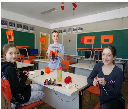
Animation du midi

À l'école St-Félix-St-Dominique, les compétences du 21 e siècle sont développées à travers différentes activités et disciplines : la robotique, l'art dramatique, l'improvisation, le spectacle de Noël, l'interdisciplinarité entre les matières et entre les groupes, le travail d'équipe, etc. Enfin, la communauté et les parents occupent une grande place dans les activités récréatives de l'école, comme le Carnaval, les Olympiades, la Fête foraine, etc. Une soirée de jeux de société est aussi organisée lors de la Semaine de la famille avec les parents et les enfants; le taux de participation est impressionnant chaque année.