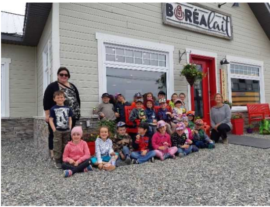
Visite à la ferme Boréalait pour les élèves de la maternelle 5 ans