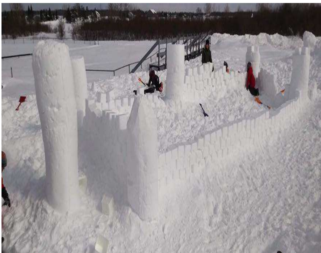
Carnaval à l'aréna de St-Félix