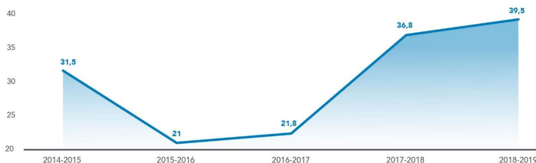
Graphique 5 - Évolution de l'écart du taux de diplomation et de qualification des élèves HDAA et des réguliers

Pour une deuxième année consécutive, l'écart de diplomation et de qualification entre les élèves réguliers et ceux HDAA se creuse et atteint 39,5 %. Le comité d'engagement pour la réussite des élèves aura comme premier mandat d'analyser les causes de ces échecs et de proposer des actions pour améliorer la réussite de ces élèves.